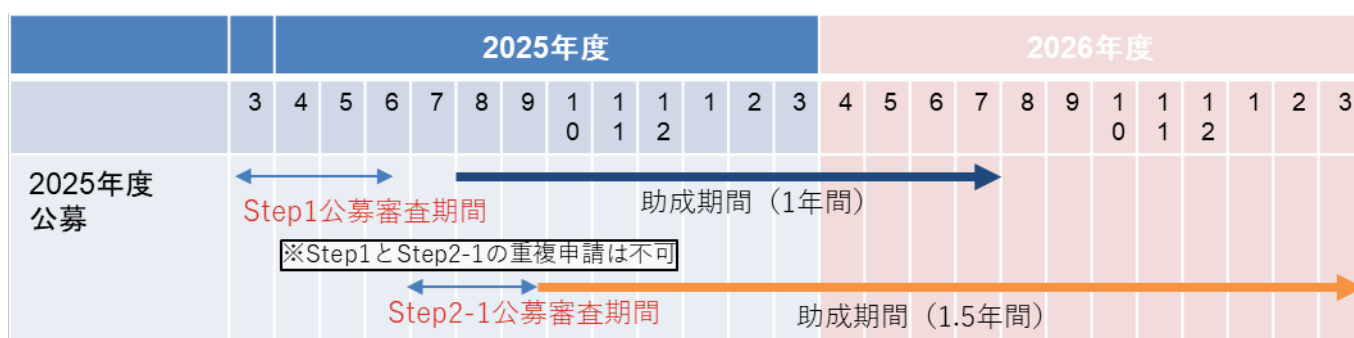
図3 2025年度公募のスケジュール